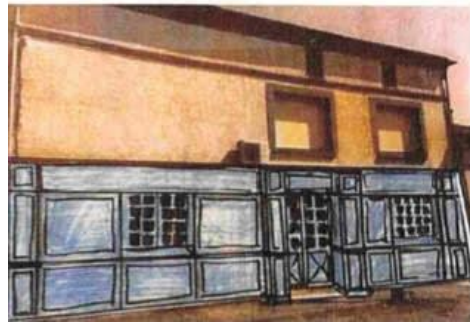
Type de façade souhaitée