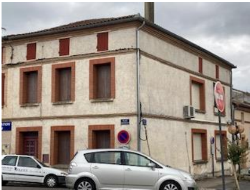
Photo du bâtiment actuel

Tel 05.63.67.30.21. – Mail mairie@ville-grisolles82.fr